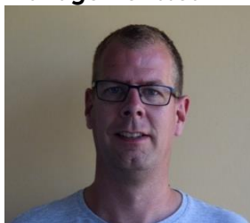
Sjors MT bovenbouw