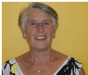
Caroline MT onderbouw